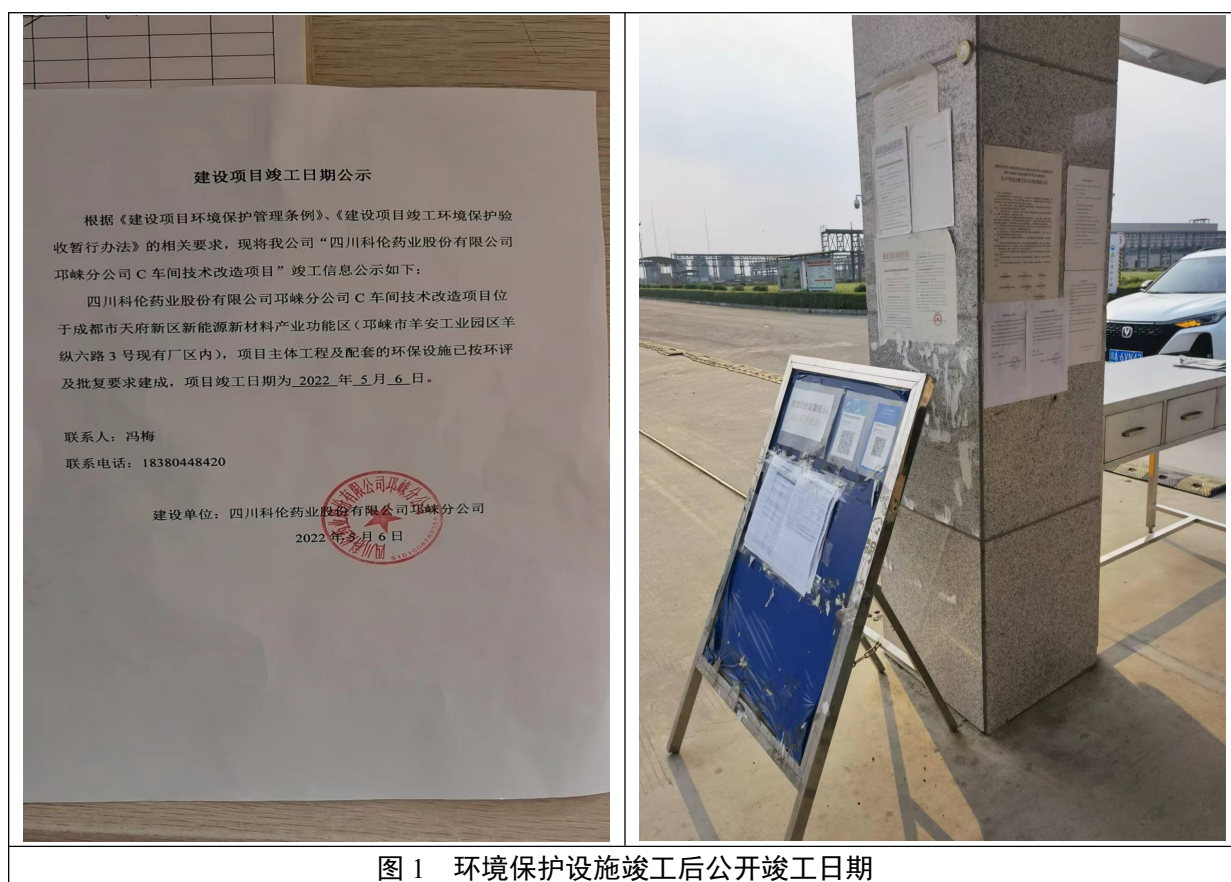
图 1 环境保护设施竣工后公开竣工日期