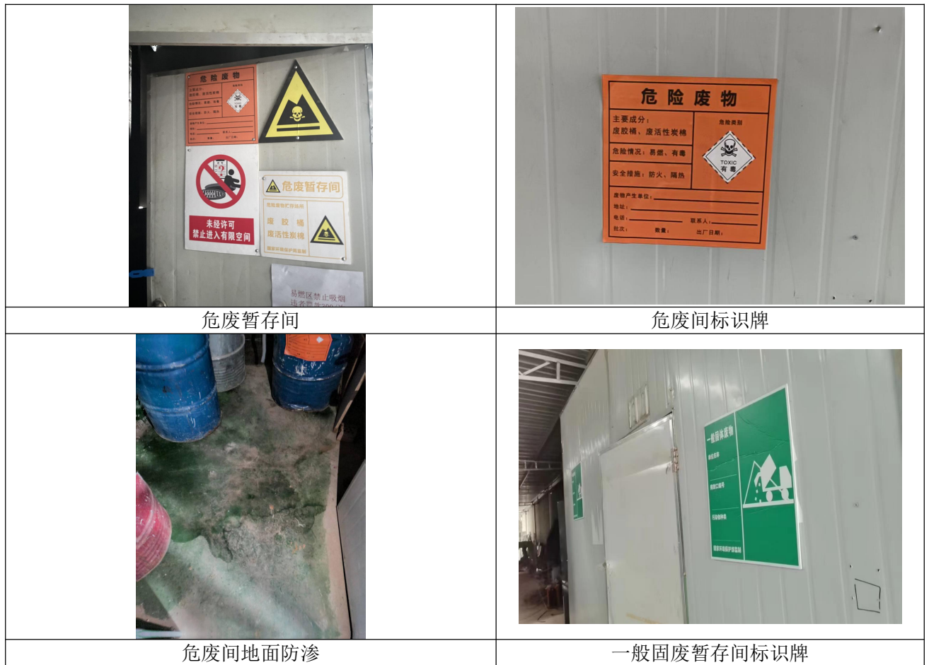
图 3-7 固废处理措施现状照片