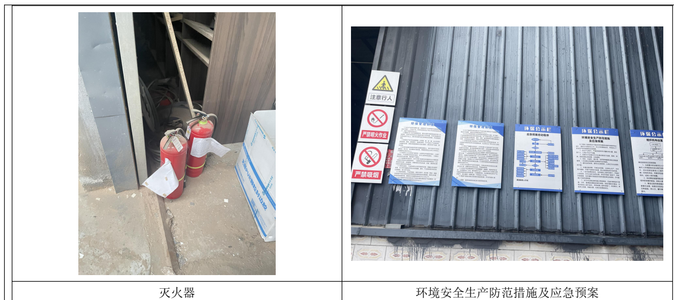
图 3-9 灭火器材现状照片