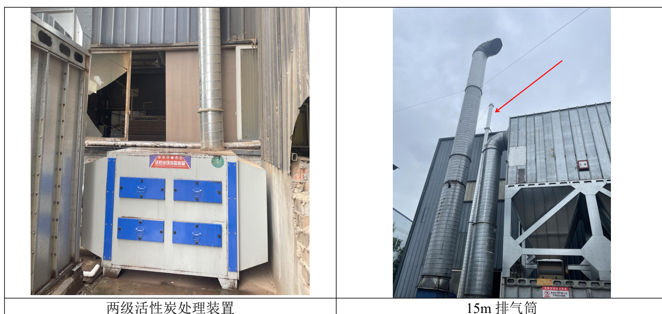
图 3-1 有机废气处理措施现状照片

项目封边工序使用全自动封边机，封边胶为无溶剂型环保胶体，在封边机内被加热到一定温度时，即由固态转变为熔融态，当涂布到人造板基材或封边材料表面后，冷却变成固态，将PVC封边条材料与板材粘接在一起，加热过程中产生的有机废气通过封边机的集气罩收集后通入一套“两级活性炭处理装置”，处理后通过1根15m高排气筒（DA001）达标排放。