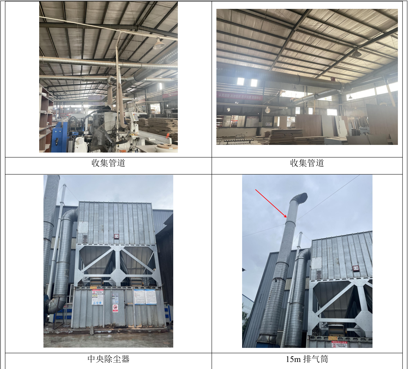
图 3-2 粉尘处理措施现状照片