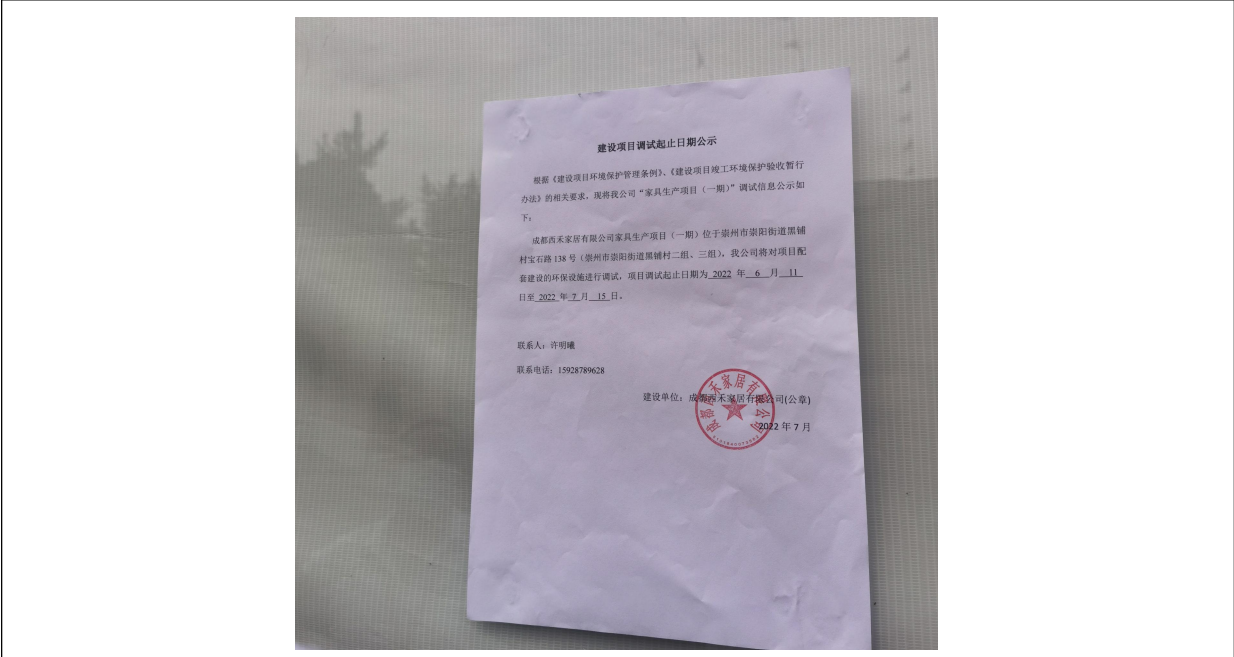
图 2 环境保护设施调试起止日期公示

2022年6月15日竣工，项目2022年6月11日至2022年7月15日进行设备运行调试，并将调试时间通过宣传栏向社会公示，详见图2。公示期间内未收到关于本项目验收的反馈意见。