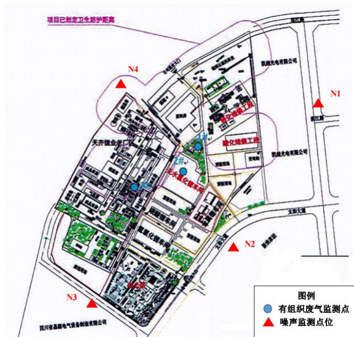
图 6.1-1 项目验收监测点位布置图