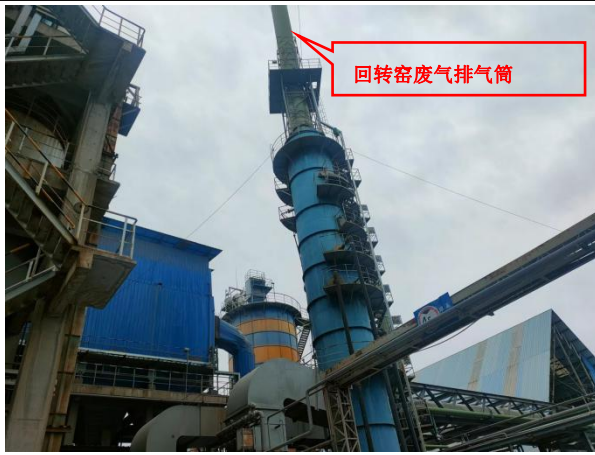
图 5 回转窑废气治理设施