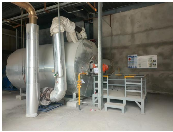
图 7 元明粉干燥蒸发系统