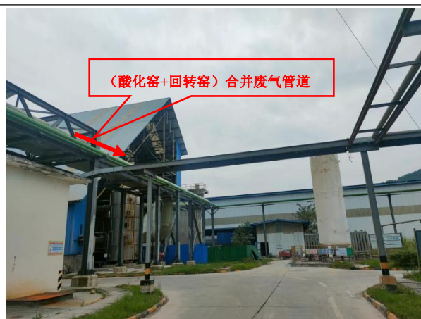
图 4 （酸化窑+回转窑）废气接入回转窑废气治理设备前