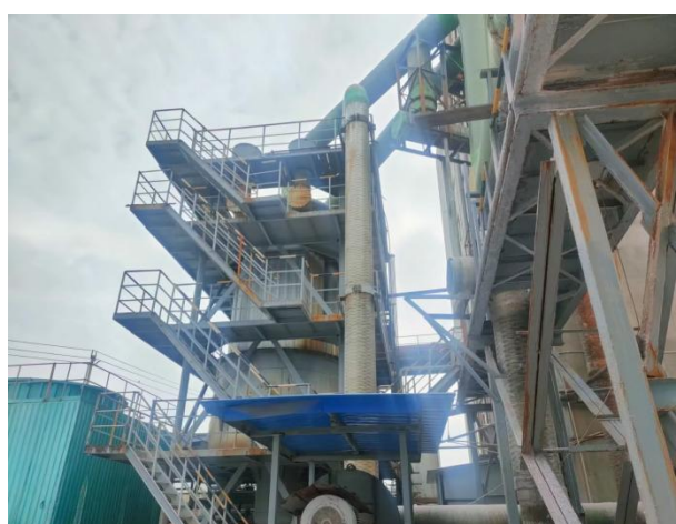
图 1 酸化窑废气治理设施（双碱法脱硫）