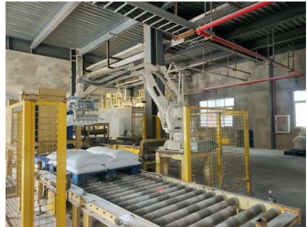
图 8 元明粉自动包装线