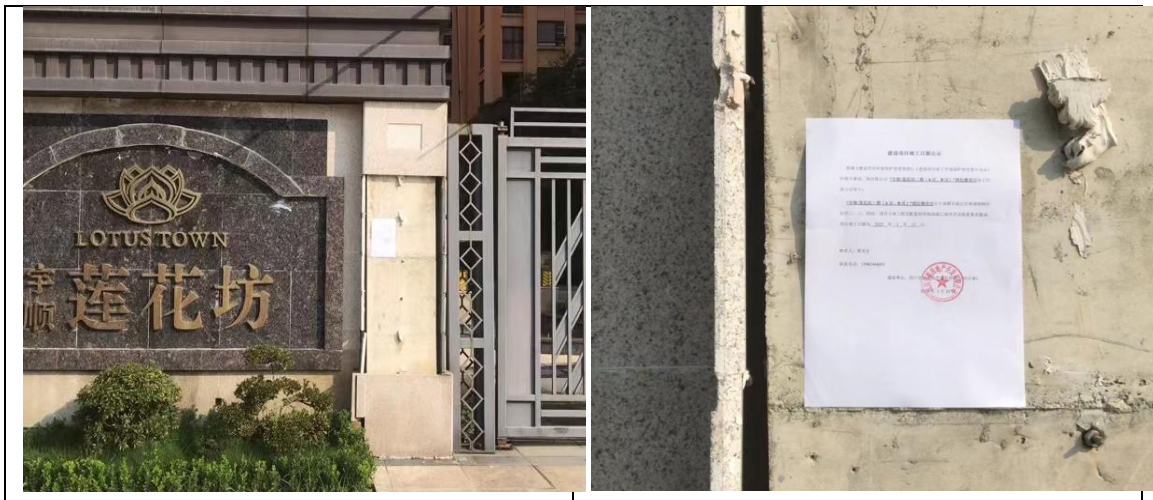
环境保护设施竣工后公开竣工日期

2022 年 1 月，“宇顺 莲花坊二期（A 区、B 区）”商住楼项目向社会公示竣工日期。