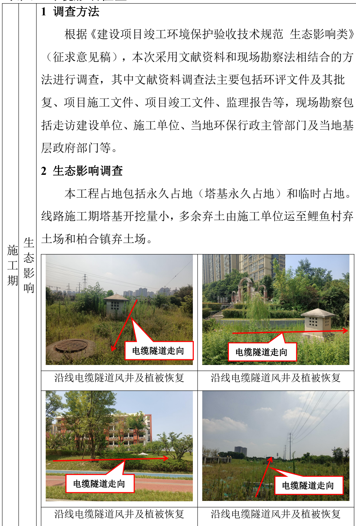
表八 环境影响检查