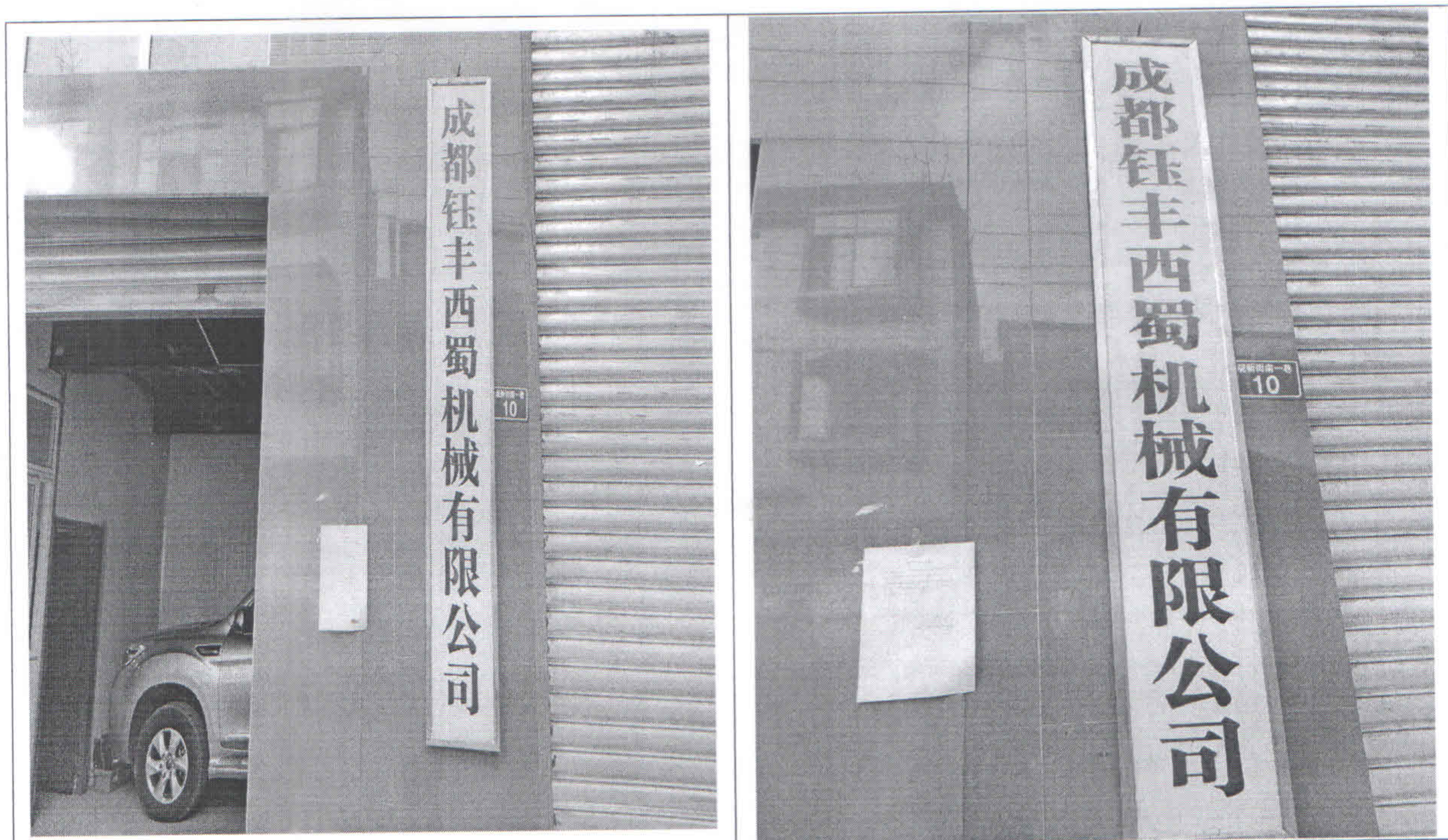
图 1 环境保护设施竣工后公开竣工日期