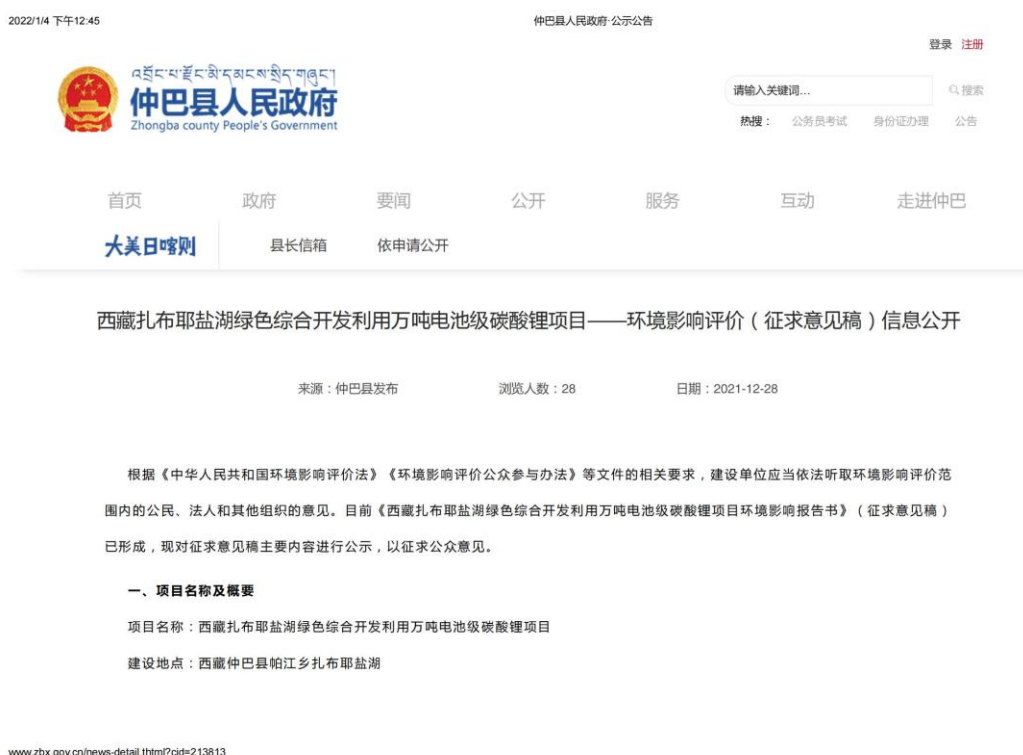
图3-1 项目环评报告征求意见稿网络公示截图一

公示时间：2021年12月28日。网站公示网址： www.zbx.gov.cn/news-detail.shtml?cid=213813 （仲巴县人民政府网站）。公示截图：见图3-1、图3-2。