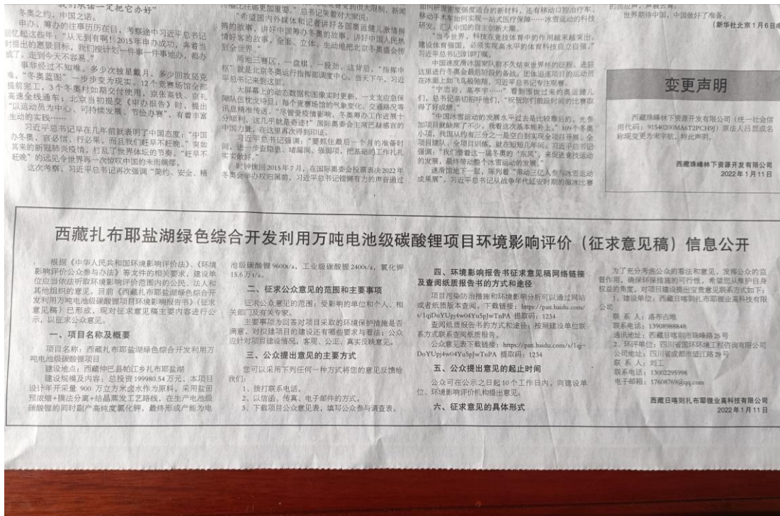
图 3-8 报纸公示内容图片二