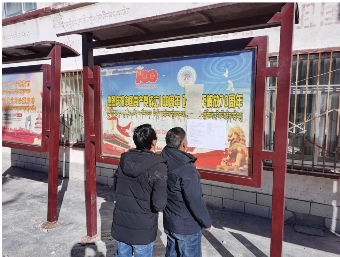
图 3-10 帕江乡公开栏张贴公示