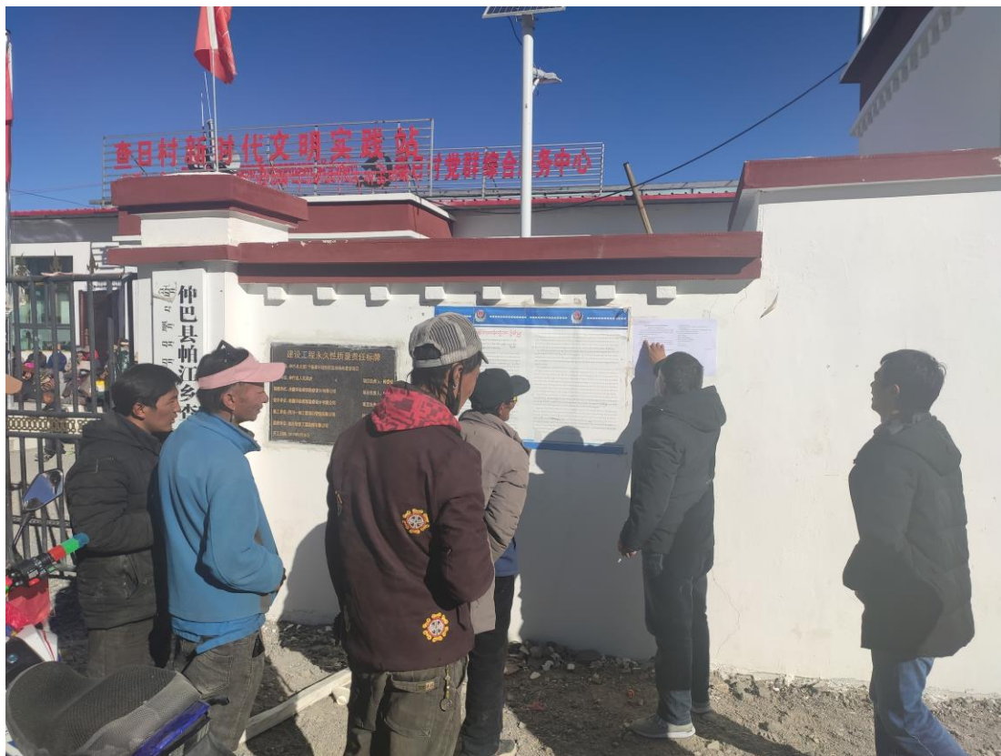
图 3-9 查日村村务公开栏张贴公示