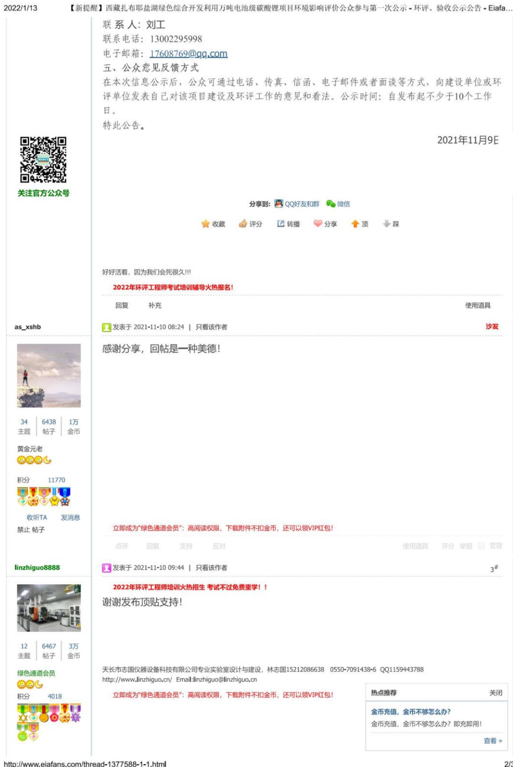
图 2-2 项目首次环评信息网络公示截图（二）