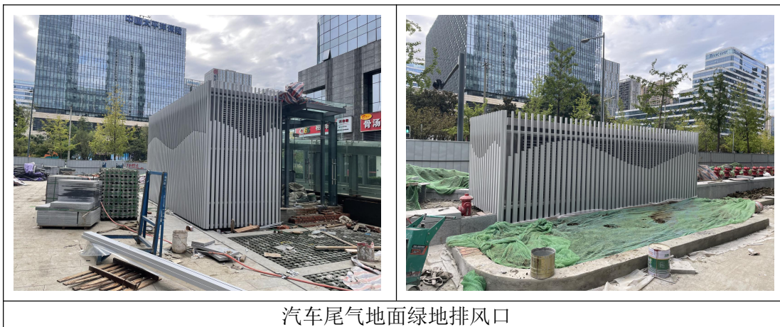
汽车尾气地面绿地排风口

本项目配套建设地下室 4 层，建筑面积 25878.81m 2 ；地下室配套机动车位 653 辆。本项目地下车库产生的汽车尾气统一收集后由抽排风系统抽至地面绿地排风口处排放，废气经扩散和植物吸附后，对区域环境产生污染影响小。