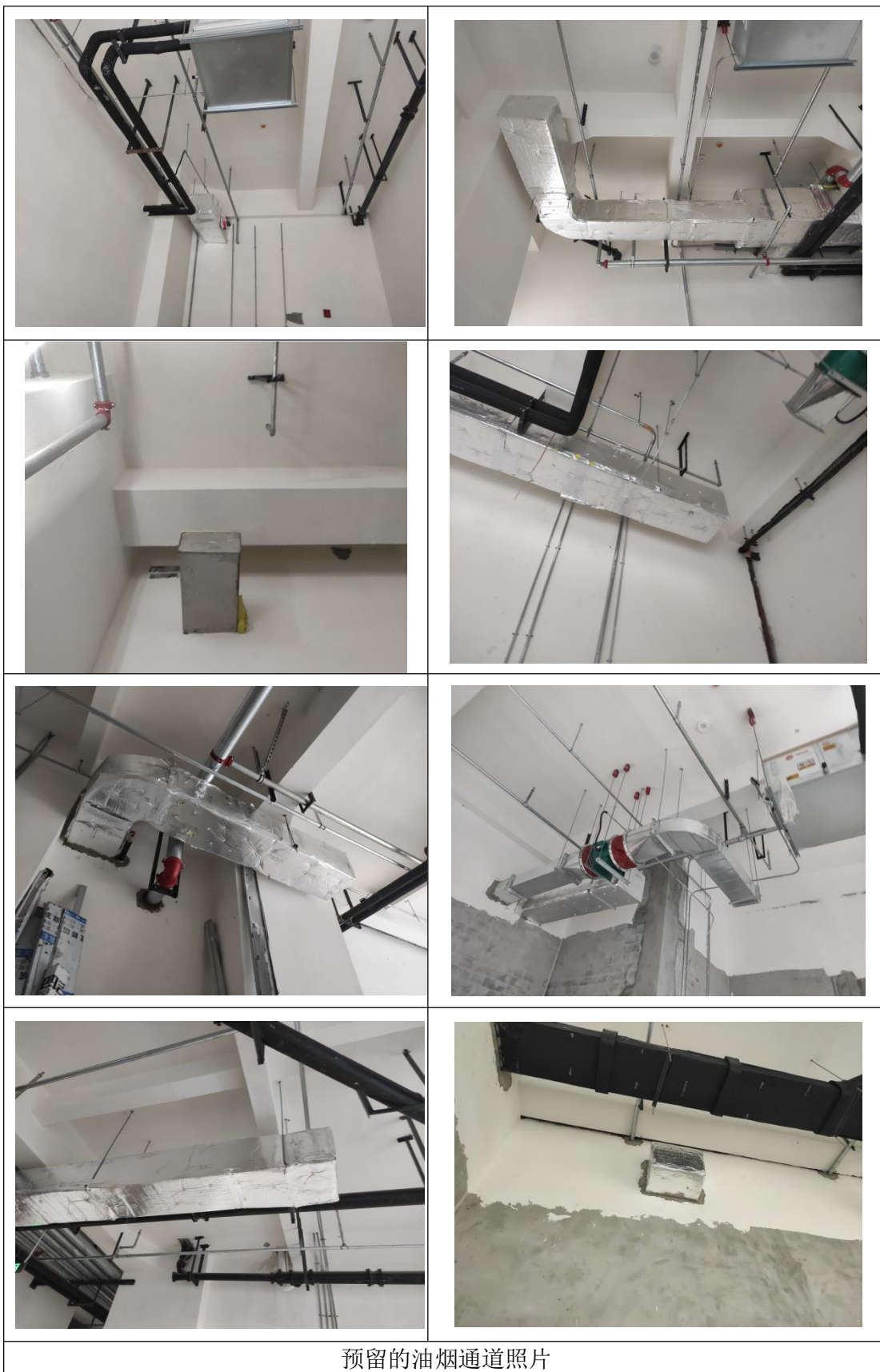
预留的油烟通道照片