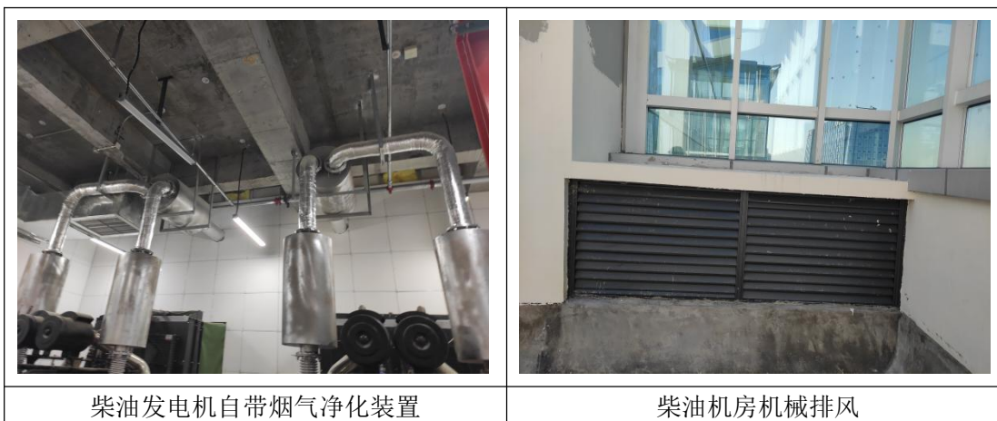
柴油发电机自带烟气净化装置

本项目在地下室设置 2 台 850kW 的柴油发电机（-1F），作为应急电源。柴油发电机使用过程中会产生废气，柴油发电机废气通过自带的烟气净化器处理后、经自带的排风系统直接接入排风竖井后，经烟道至 1 号楼楼顶排放。