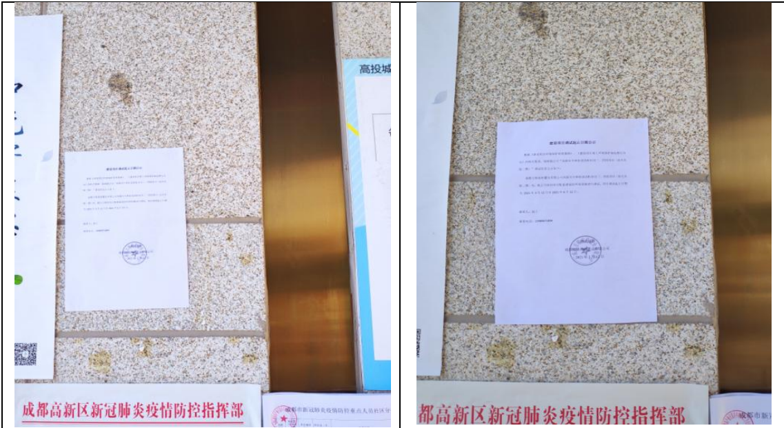
环境保护设施调试起止日期公示