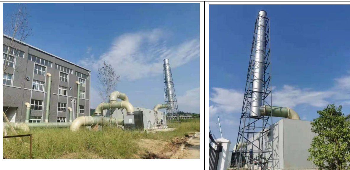
废气处理措施照片

项目污水处理过程中，厂内粗格栅及提升泵房、细格栅及沉砂池、生化池厌氧区、污泥处理系统等处理构筑物内均有恶臭气体产生，主要采取植物措施和工程措施进行控制。其中：植物措施主要为厂界四周种植绿化隔离带，选用抗污力强、净化空气好的植物；工程措施主要对粗格栅、细格栅、沉砂池、脱水机房采用不锈钢骨架+PC耐力板加罩，生化池采用膜加盖，共设置 2 套生物除臭系统（分别用于预处理、生化处理及污泥处理系统除臭），臭气经处理后经 15m 高排气筒有组织排放。