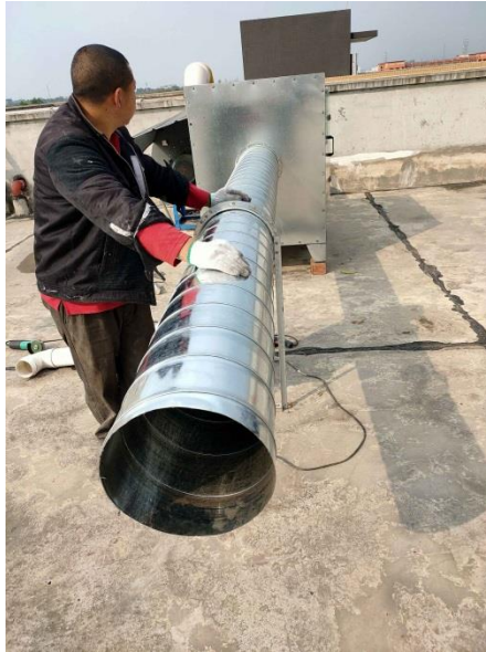
图 3-1 项目废气收集设施、处理设施及排气筒