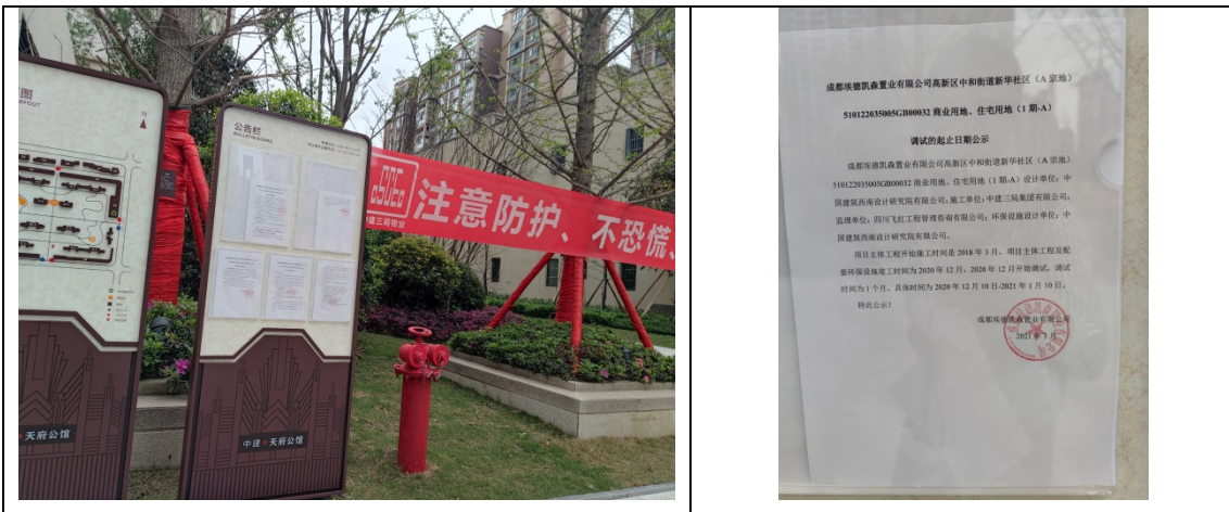
环境保护设施调试起止日期公示

项目于2020年12月竣工,项目2021年1月1日至2021年1月31日进行设备运行调试,并将调试时间通过宣传栏向社会公示。